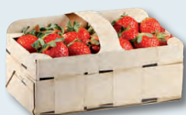
90506 (auf Anfrage) 1 kg Komfort Spankorboptik