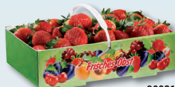
90031 1,5 kg