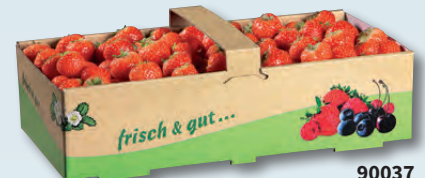
90037 2 kg