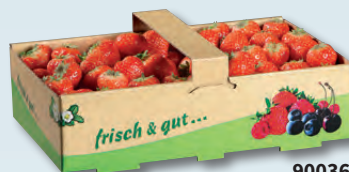
90036 1,5 kg