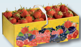
90024 1 kg