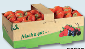
90035 1 kg