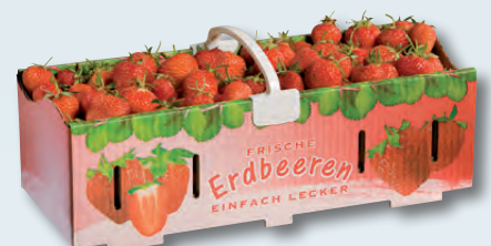
90016 2,5 kg gewachst