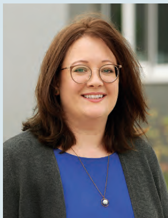
Telefon +49 (0) 7276 9653-25 Telefon +49 (0) 7276 9653-12 Telefon +49 (0) 7276 9653-51