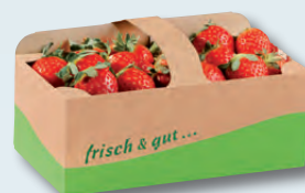
90507 1 kg Komfort "frisch & gut"