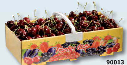
90013 2 kg